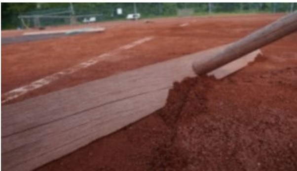
Löcher immer schließen

Beim Spielen kommt es immer wieder vor, dass Löcher und Unebenheiten entstehen. Bitte tretet diese sofort zu und zwar entgegen der Richtung des Aushubs. Würde man mit dem Schleppnetz oder Besen abziehen, ohne die Löcher zuzutreten, wäre das ausgetretene Material verteilt aber das Loch immer noch vorhanden. Sollte die schwarze Lavaschicht zum Vorschein kommen, müsst ihr das Spielen sofort einstellen und ein Vorstandmitglied informieren. Gleiches gilt für den Fall, dass die Linien unterspült, hochstehen oder ausgerissen worden sind.